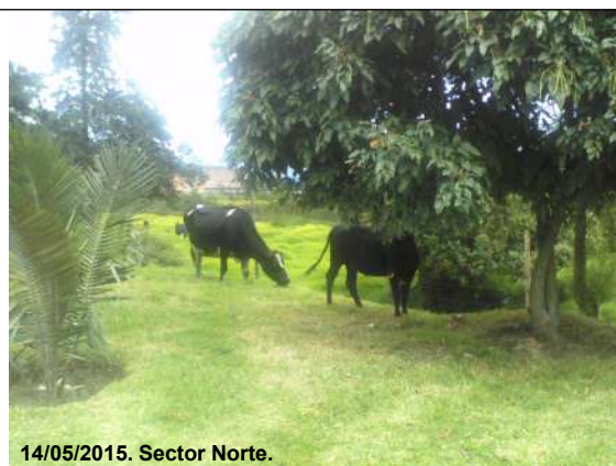
14/05/2015. Sector Norte.

Foto 8. Bovino observado en el sector Norte, predio No. 7 (Tabla 6), chip AAA0196FEXS.