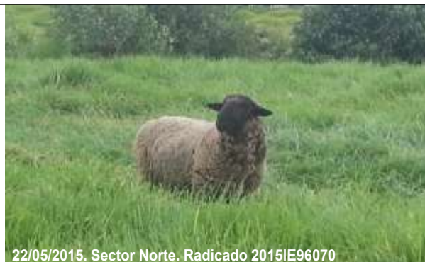
22/05/2015. Sector Norte. Radicado 2015IE96070

Foto 10. Bovino y Equino al interior del cuerpo de agua del humedal, sector Norte, chip AAA0078JWSK, predio 1 (Tabla 6).