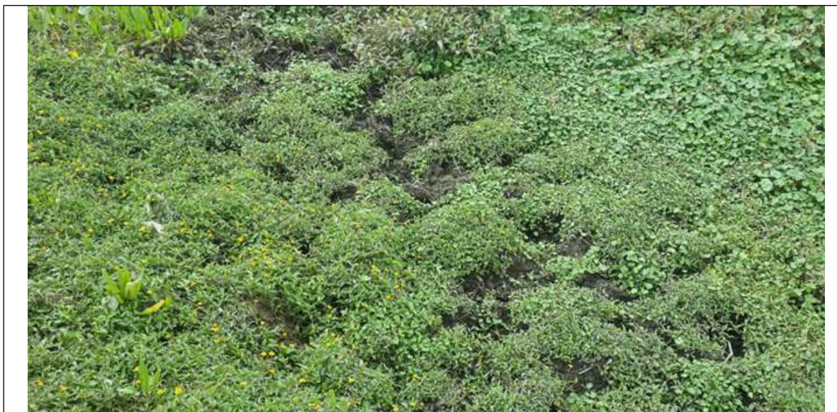
Foto 19. Evidencias de huecos el suelo en el PEDH Capellanía, sector Sur, por pisoteo de semovientes. Fecha 11/10/2013, Radicado 2015EE169578.