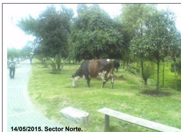
14/05/2015. Sector Norte.

Foto 8. Bovino observado en el sector Norte, predio No. 7 (Tabla 6), chip AAA0196FEXS.