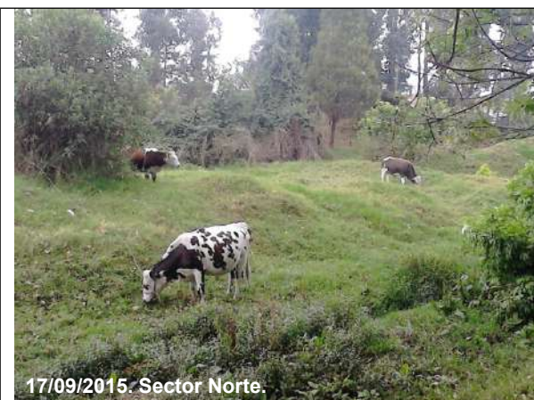
17/09/2015. Sector Norte.

Foto 11. Ovino observado en el sector Norte, predio No. 1 (Tabla 6), chip AAA0078JWSK.