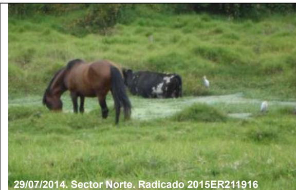
29/07/2014. Sector Norte. Radicado 2015ER211916

Foto 10. Bovino y Equino al interior del cuerpo de agua del humedal, sector Norte, chip AAA0078JWSK, predio 1 (Tabla 6).