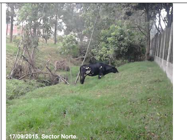
17/09/2015. Sector Norte.

Foto 12. Bovinos observados en el sector Norte, predio No. 9 (Tabla 6), chip AAA0232CSWW.