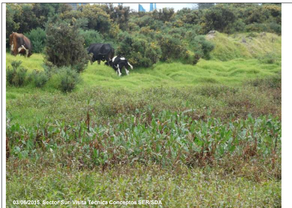
03/06/2015. Sector Sur. Visita Técnica Conceptos SER/SDA