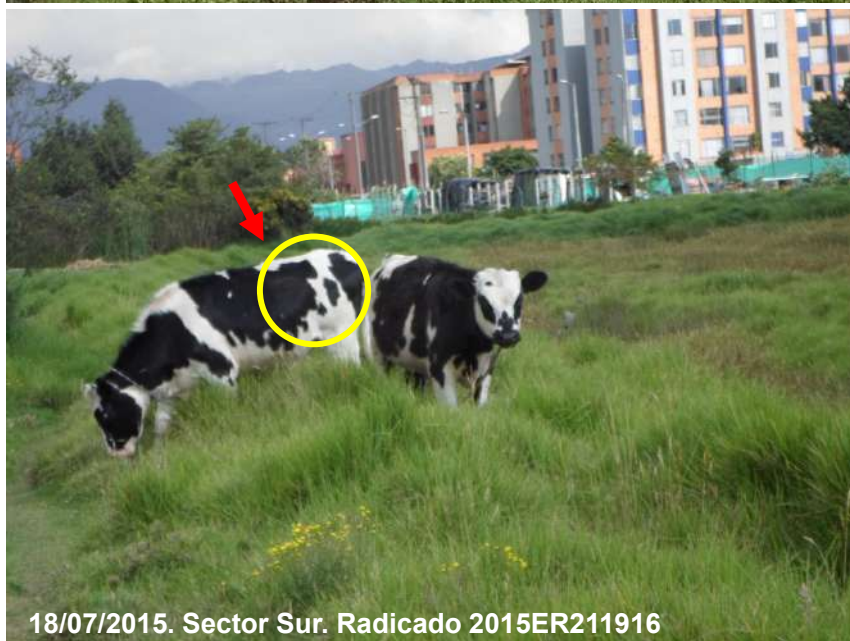
Imagen 11. Observación de semoviente en diferentes fechas en los días 18/04/2015 y 18/07/2015.