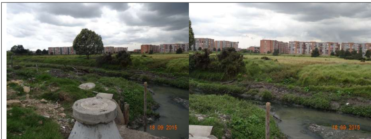
Foto 20. Zona de restauración en el PEDH Capellanía, donde se ha identificado fuertemente la actividad de pastoreo de semovientes.