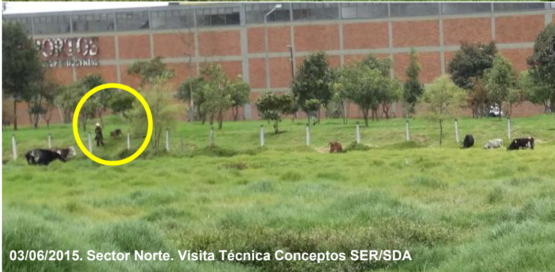
Imagen 10. Semovientes observados en el sector Norte, predio No. 7 (Tabla 6), chip AAA0196FEXS.